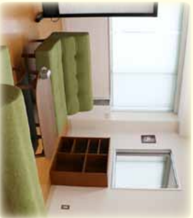
カウンセリングルーム